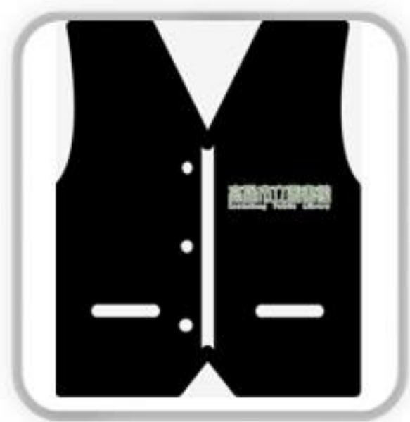
館員 (黑色背心/圍裙)