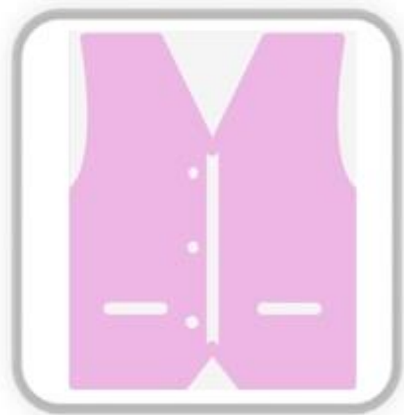
志工 (粉紅背心/紅圍裙)